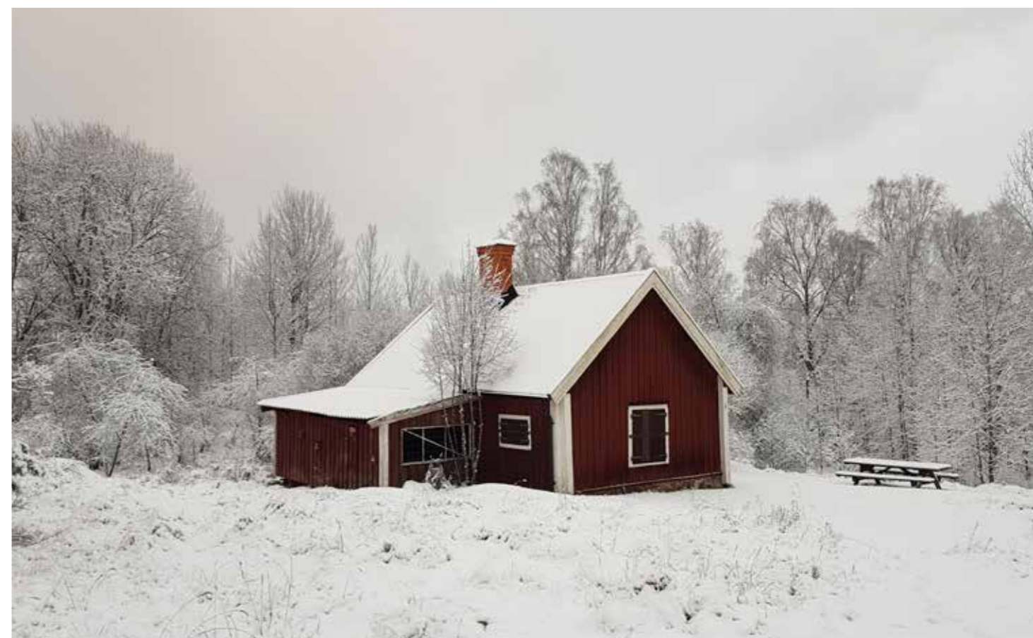
Fig. 6. Ekonomibygnad.