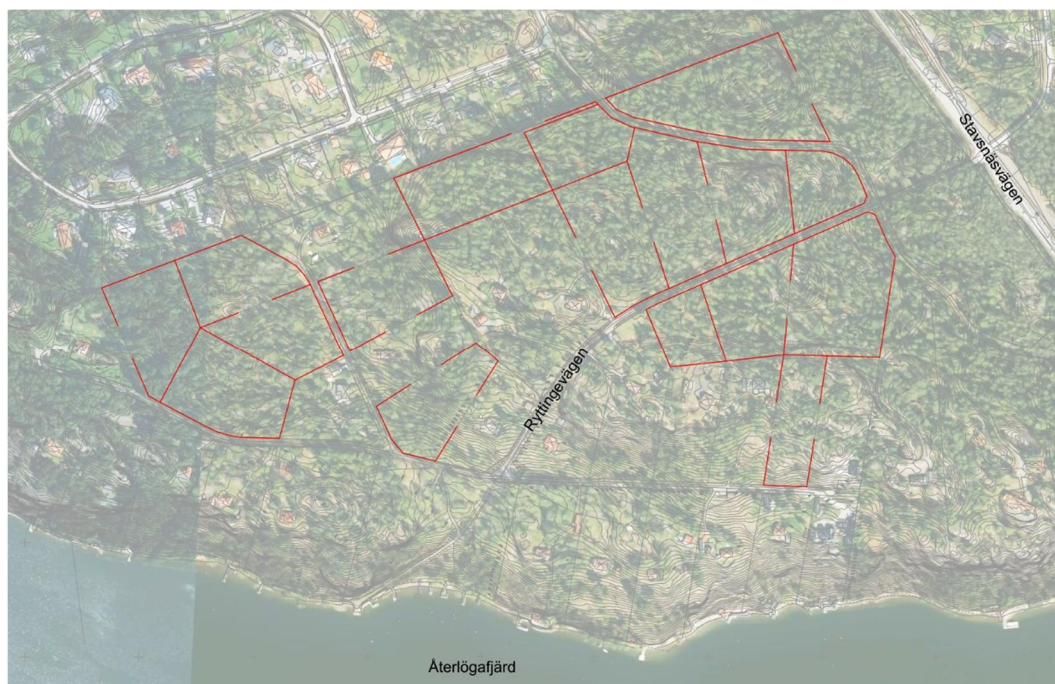
Figur 1. Aktuella tomter som denna utredning omfattar.

Syftet med utredningen har främst varit att, för 17 obebyggda fastigheter, klarlägga markbyggnadstekniska förutsättningar och lämpligheten att bereda ny tomtmark med hänsyn till stabilitetsförhållanden samt identifiera eventuella geotekniska risker som kan behöva utredas vidare inom detaljplaneprocessen.