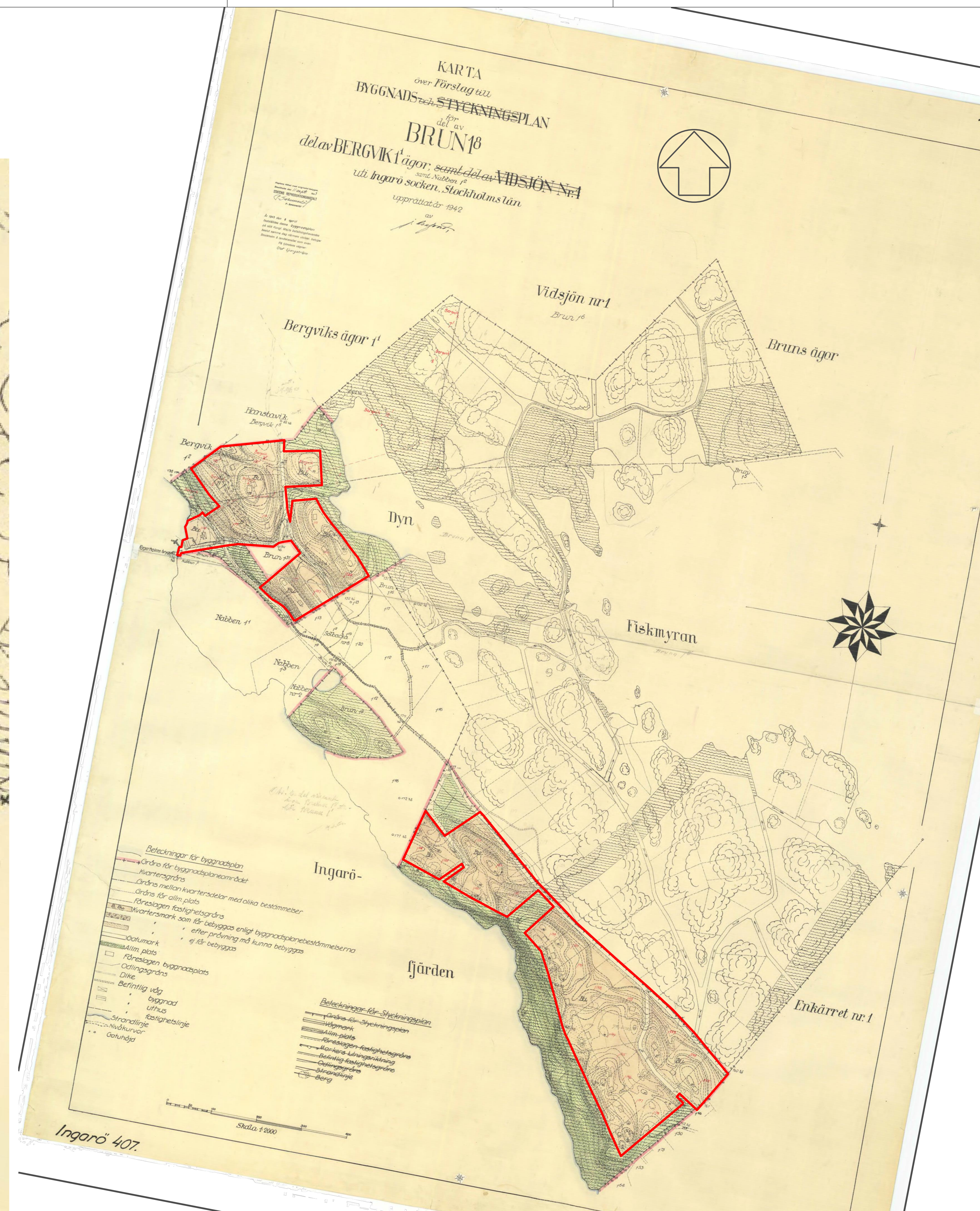
Del av byggnadsplan 5, plankarta med byggnadsplan södra delen