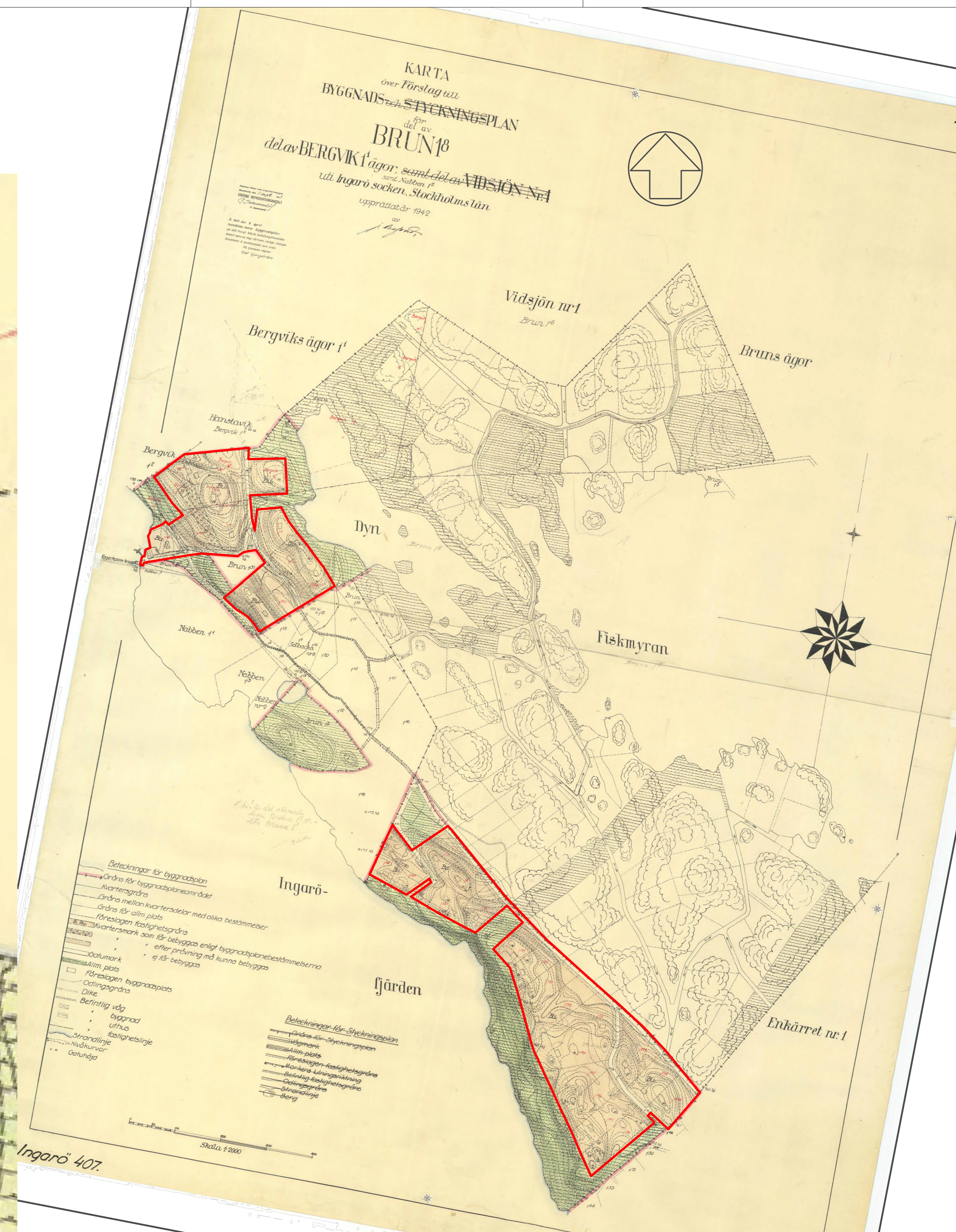
Del av byggnadsplan 5, plankarta med byggnadsplan norra delen