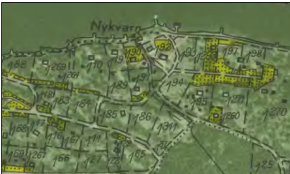
Nykvarn på 1952 års karta. Här syns att fler byggnader har uppförts, men att några tomter ännu var obebyggda.