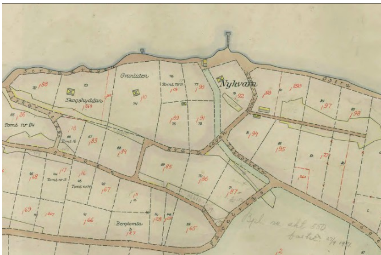
Nykvarn på en karta från 1912. Här syns de avstyckade tomterna och att några villor har byggts. Några tomter har namn utskrivna, exempelvis Granliden och Skogshyddan, vilket var typiska namn i områden som bebyggdes från sent 1800-tal och in på 1900-talet.