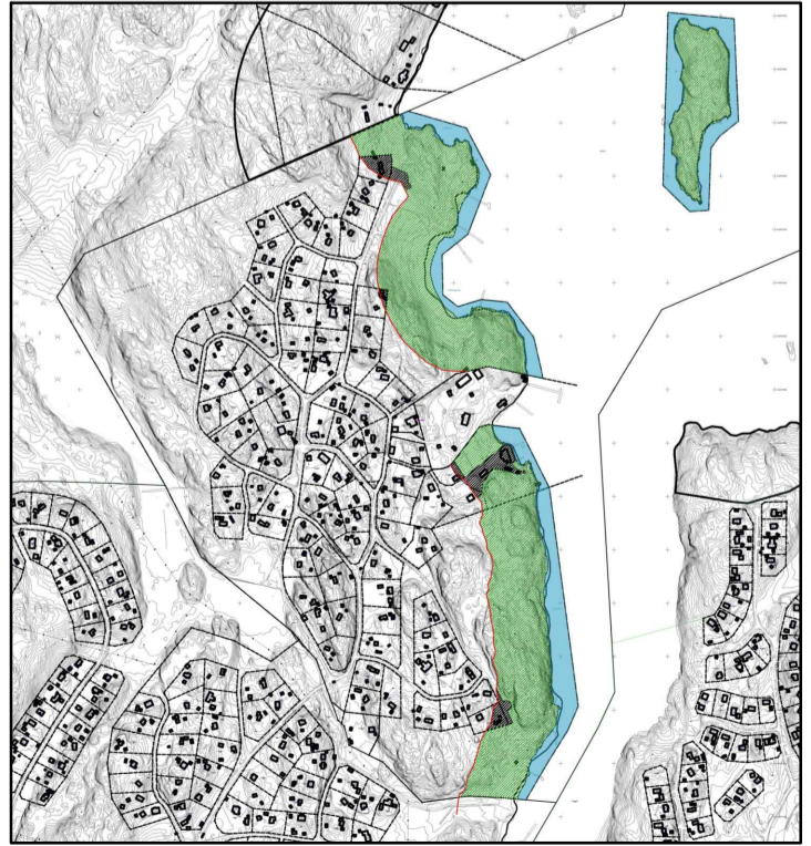
Röd linje markerar strandskydd 100 meter från strandlinje. Inom gråmarkerade områden upphävs strandskyddet. Inom grön- och blåmarkerade områden gäller strandskyddet.