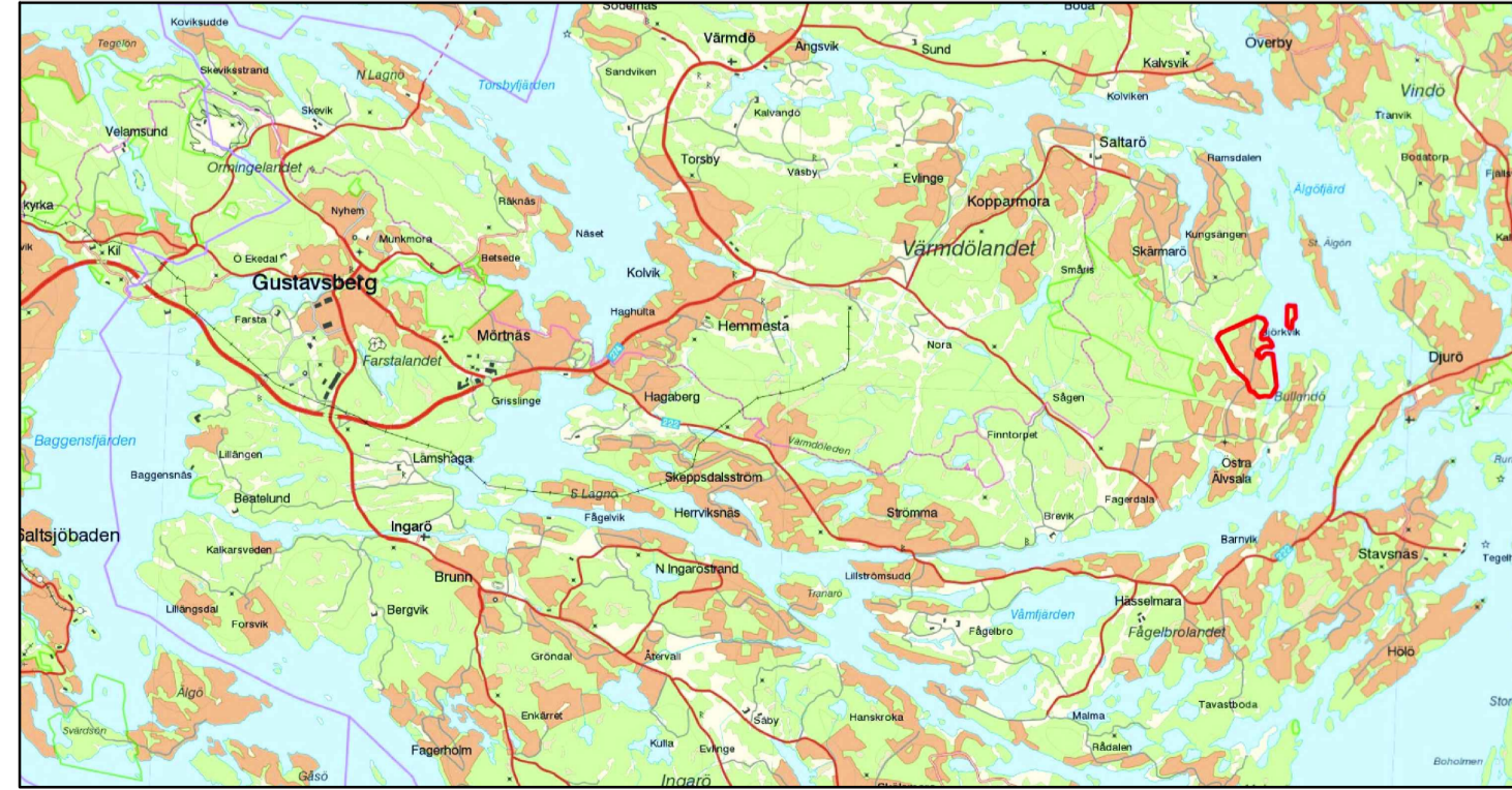
Röd linje markerar planområdet inom Värmdö kommun