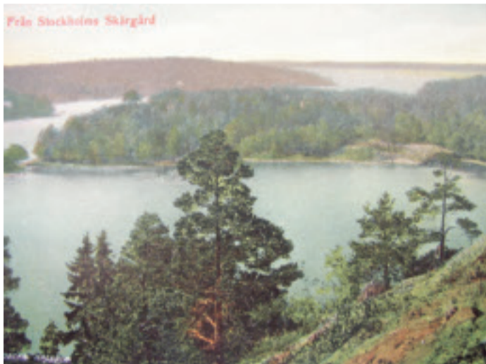
Vykort från tidigt 1900-tal med vy från Blåsut. Den smala inloppspassagen till Gustavsberg, Farstabrohål, till vänster.

Svårighetsgraden att nå utsiktsplatserna anges för varje berg. Terrängen är i de flesta fall starkt kuperad varför tåliga skor rekommenderas. Se upp för branta stup, och undvik att besöka platserna vid blöt väderlek p g a halkrisken. Förutom den sista biten till fots så kan alla utsiktsbergen nås med cykel via vägar och cykelvägar. I texten anges förslag på lämpliga cykelvägar. Kartutsnittet visar på lämpliga stigar till utsiktsplatsen. Inga stigar är dock markerade i fält. Har du tillgång till GPS så anges dessutom koordinater för varje utsiktsberg (rikets koordinatsystem i RT90, 2,5 gon V).