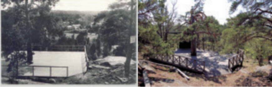
Till vänster Lagnö dansbana på 1920-talet. I bakgrunden syns Lagnö by. Till höger Lagnö dansbana i nutid.

Från berget har man en fin vy över Torsbyfjärden som dagligen korsas av färjetrafiken till och från Finland och Baltikum. Man ser även utsiktsberget Tynningö klack på andra sidan farleden, se längre fram om bergets historia.