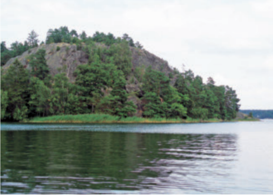
Fornborgsberget, Lämshaga.