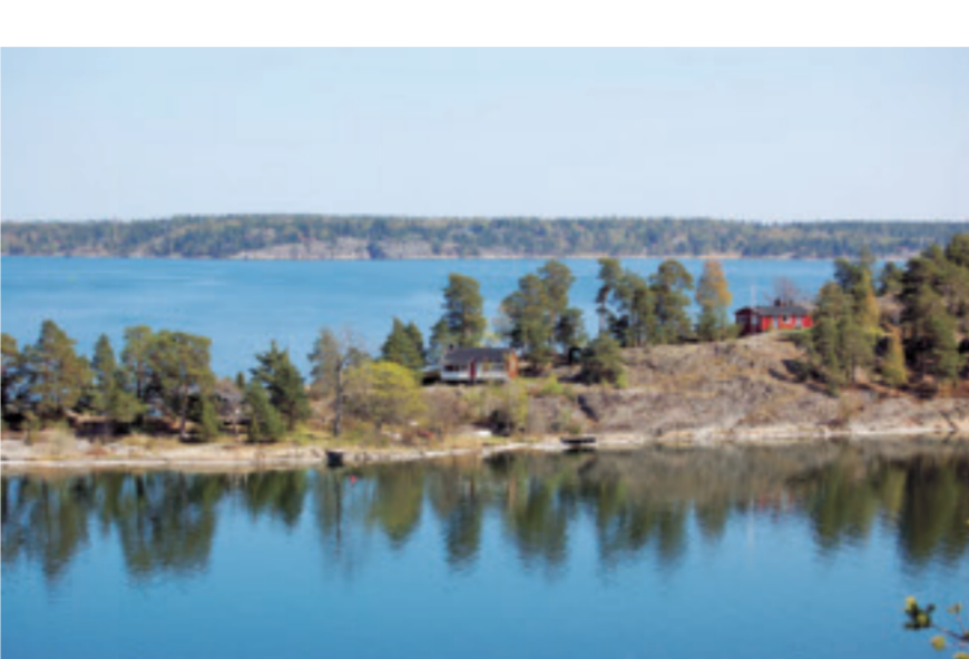
Utsikt från Dansbaneberget mot äarna Bergholmen och Torsholmen i Torsbyfjärden.

I nordväst gränsar Mörtlös till Ösbyträsk naturreservat. Området är omväxlande med såväl barrskog, ädellövskog, strandskog som öppna hagmarker. Flera stigar genomkorsar området, bl a Ösbyrundan runt sjön Ösbyträsk och Värmdöleden som fortsätter genom Mörtlös via Västerleden.