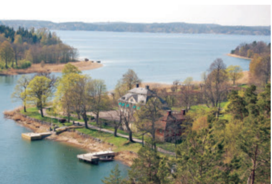
Utsikt från Flaskberget mot Baggensfjärden, Kolström och Beatelund närmast i bild.

Från berget ser man ut över Baggensfjärden. Den skarpögde kan faktiskt se Södersjukhuset rakt västerut genom det sprickdalsstråk som bildas av Lännerstasundet, Järlasjön och Sicklasjön – skärgårdsbornas forna farled till Stockholm. Om man följer Flaskbergets rygg ett litet stycke österut ser man Ingaröbron. På toppen finns resterna av fundamentet till ett utsiktstorn som revs i början på 1960-talet. Tornet var en 50-årspresent till ägaren av Beatelunds säteri, jästfabrikören Sten Westerberg (1884-1956) som förvärvade gården 1923.