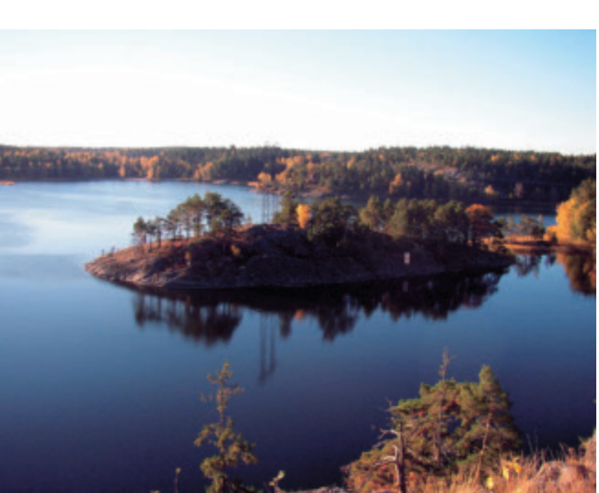
Vy över Getholmen från Fornborgsberget vid Länshaga.